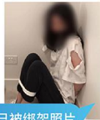
受害人拍摄自己被绑架照片