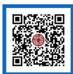
教育部平安留学 微信公众号