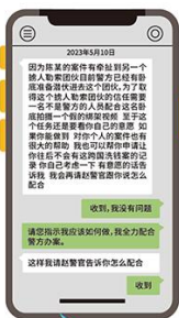
诈骗分子以配合警方卧底为由诱导受害人“虚拟绑架”

诈骗分子引导受害人拍摄被绑架的照片、视频。以受害人曾自导自演“绑架案”逃避侦查为由，要求其拍摄视频作为对比以自证清白。或是当受害人无法按照要求缴纳巨额保证金时，诈骗分子声称让受害人伪造被绑架的假象，以向其家人索取资金。或是声称受害人本人或父母涉嫌重大案件，若其配合拍摄照片、视频，配合警方完成秘密任务，即可获得宽大处理。