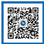
外交部领事直通车 微信公众号