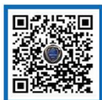
国家反诈中心 微信视频号

国家反诈中心、外交部领事保护中心、教育部留学服务中心开通官方政务号,全面解析高发诈骗类型,宣介海外反诈常识,发布海外反诈提醒,欢迎关注。