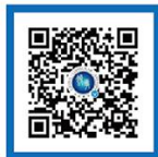
外交部领事直通车 微博号