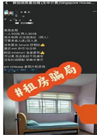
诈骗分子在群内发布虚假租房广告

诈骗分子伪装成驻外使领馆工作人员、房东或中介、培训机构工作人员等身份，在网络社交工具、网页、搜索引擎等渠道发布广告，以可提供办理签证、租房、升学、代写论文等服务为诱饵，吸引有需求的群体并建立联系。