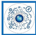
外交部领事直通车 抖音号