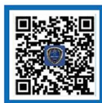
国家反诈中心 APP ios 下载