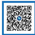
外交部领事直通车 快手号