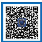
国家反诈中心 APP Android 下载

国家反诈中心APP是一款官方手机防骗保护软件,集诈骗预警提示、报案助手、线索举报、反诈宣传等多种功能于一体,可以有效提升用户的识骗防骗能力。