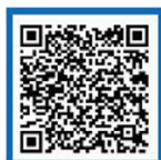
国家反诈中心 快手号