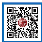
教育部平安留学 网站