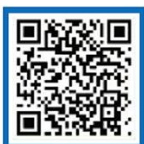
国家反诈中心 微博号