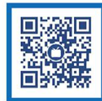
外交部领事直通车 哔哩哔哩号